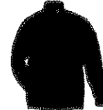
Sueter con cuello de tortuga