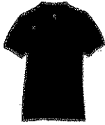
Polo de manga Larga o corta