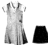
Faldas o skorts