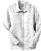
Blusa de manga larga o corta